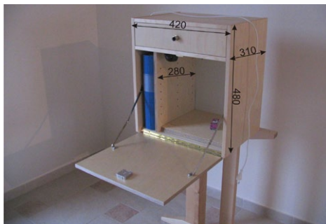
Öppet skåp, djup 31 cm (placerat på bord men är normalt vägghängt)